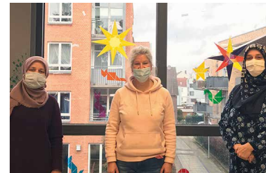
Das Gespräch führte Kerstin Holst, Leitung Kinder- und Jugendatelier im Atelierhaus Roter Hahn

Asygül: „Ich habe das Gefühl, dass die Kinder sonst nicht so frei in ihrer Rede sein können. Und ihre Eigenverantwortung an die Eltern abgeben.“